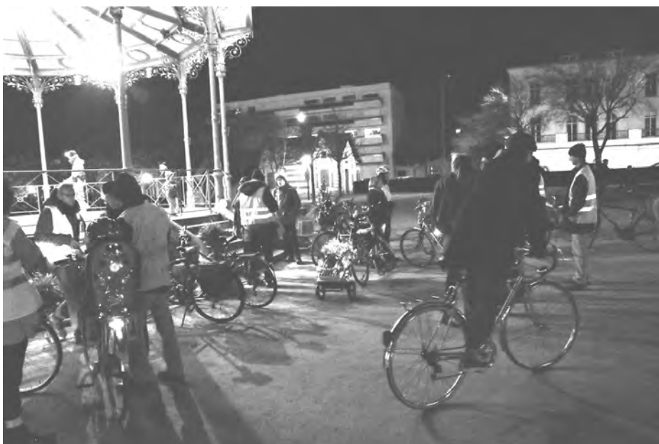
Arrivée de la parade lumineuse au Jardin du Mail le 16 décembre dernier

Quelques semaines plus tôt la Ville avait renouvelé sa campagne de communication sur le vélo, axée cette année à notre demande sur l'éclairage.