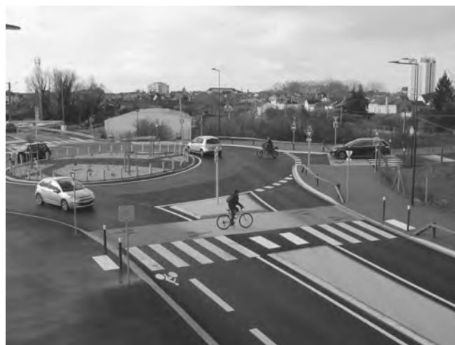
Aménagement du pont Langlade (à droite de la photo). Beaucoup mieux mais peut mieux faire, notamment en matière de signalisation...

Ce pont n'autorisait de passer au-dessus des voies ferrées à vélo que dans un seul sens (en venant de l'avenue Montaigne). Une voie permet maintenant de le franchir aisément dans les deux sens à pied ou à vélo et de voir se profiler du côté sud, en parallèle aux voies de chemin de fer, une voie verte bien engagée. Un rond-point (à l'extrémité sud du pont Langlade) permet depuis quelques mois de répondre à cette attente très ancienne des cyclistes.